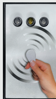
Champ de lecture de transpondeurs

L'autorisation d'un transpondeur n'est possible que sur les champs de lecture de transpondeurs signalisés. Les champs d'affichage servent uniquement à donner des informations sur les états de fonctionnement.