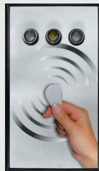
Câmp de transponder

O autorizare prin intermediul transponderului este posibilă numai la câmpurile de transponder. Câmpurile de afișare servesc numai pentru semnalizarea stărilor de operare.