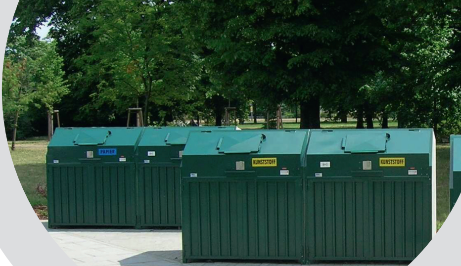
Universalboxen und imvisio Müllschleuse in Sonderausführung (Farbgebung grün)